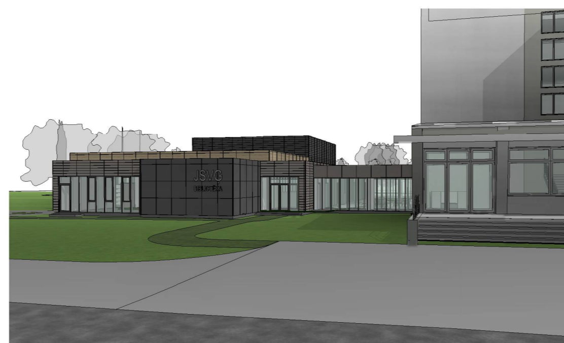
Skats uz bibliotēku no Sarmas ielas Nr.2