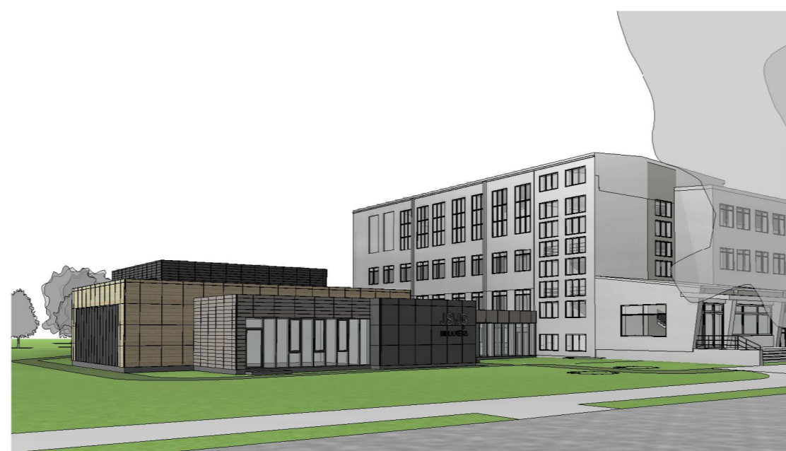
Skats uz bibliotēku no Sarmas ielas Nr.1

Jelgava, Sarmas iela 2, 2A un 4A, zemesgabalu kad. nr. 9000020739, 09000020006 un 09000020014