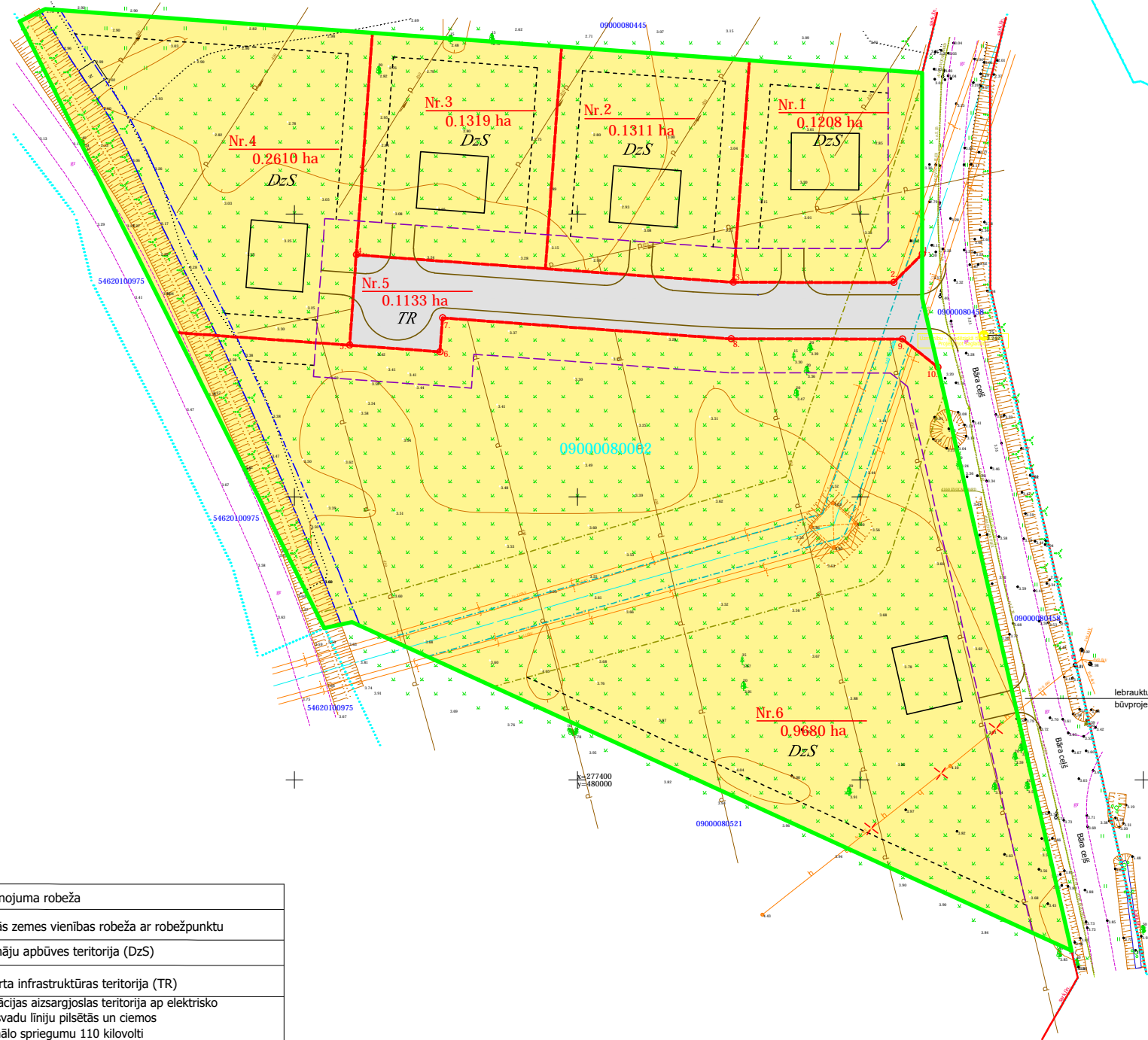
Projektētās teritorijas shēma pirms detālplānojuma izstrādes